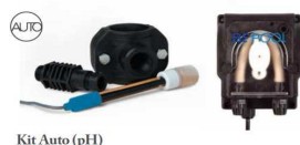
Kit Auto (pH)